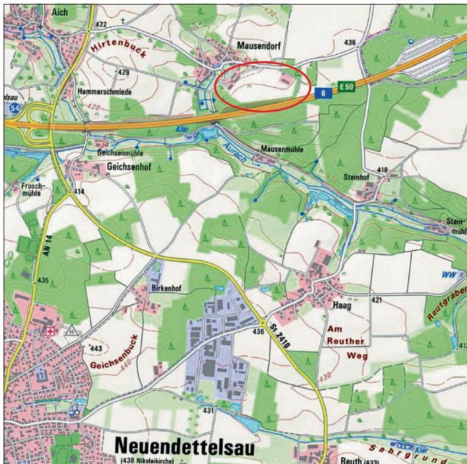
Kartenausschnitt mit Änderungsbereich (Kartengrundlage Bayerische Vermessungsverwaltung 2022)

Planungssicherstellungsgesetz (PlanSiG) i. V. m. § 4a Abs. 4 BauGB auf der Homepage der Gemeinde Neuendettelsau ( www.neuendettelsau.eu ) zur Einsicht zur Verfügung gestellt unter der Rubrik „Leben & Gewerbe“, „Bauen & Wohnen“, „Bauleitplanung“. Während der Auslegungsfrist können die Planunterlagen eingesehen werden und es wird der Öffentlichkeit Gelegenheit zur Äußerung und Erörterung gegeben. Hierbei können Anregungen und Bedenken in Textform oder mündlich zur Niederschrift vorgetragen werden. Da das Ergebnis der Behandlung der Stellungnahmen mitgeteilt wird, ist die Angabe des Verfassers zweckmäßig.