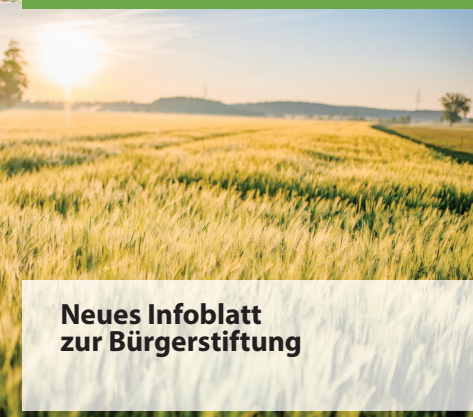
Neues Infoblatt zur Bürgerstiftung