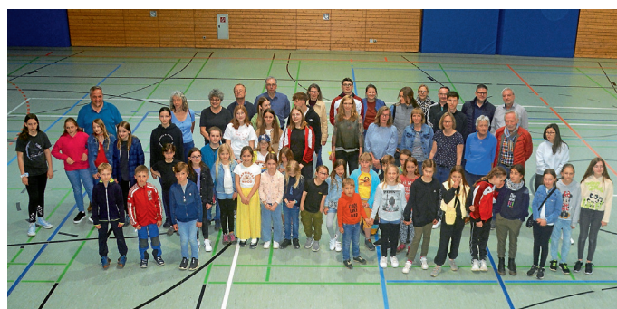
Die fittesten Neuendettelsauer/innen 2022

Sport hält gesund und bringt Menschen zusammen. Das sind zwei gute Gründe, um für das Sportabzeichen zu trainieren. Und natürlich ist es ein wunderbares Gefühl, wenn man sein Abzeichen schließlich in den Händen hält.