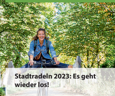
Stadtradeln 2023: Es geht wieder los!