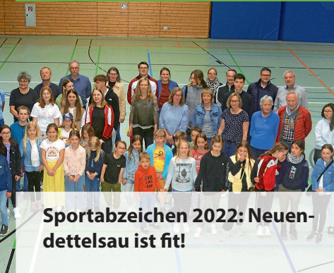
Sportabzeichen 2022: Neuendettelsau ist fit!