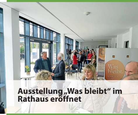
Ausstellung „Was bleibt“ im Rathaus eröffnet